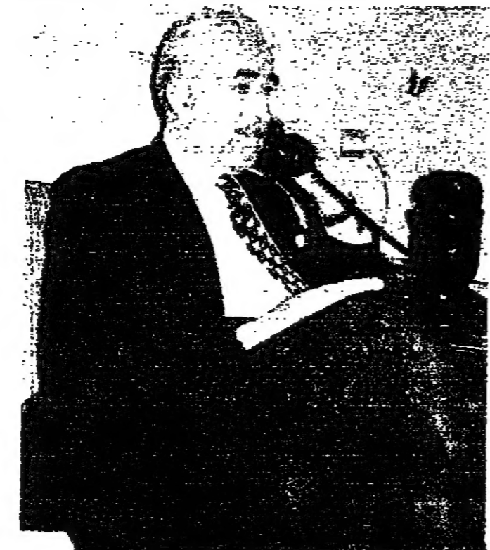
الرئيس كرامي في منزله يرد على اتصال هاتفسي